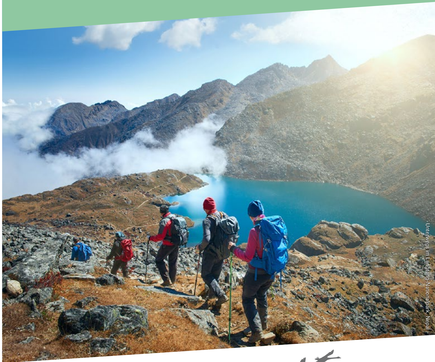
Unterwegs im Langtang-Nationalpark, Nepal